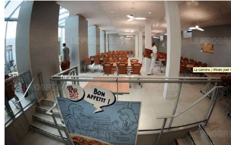
La cantine